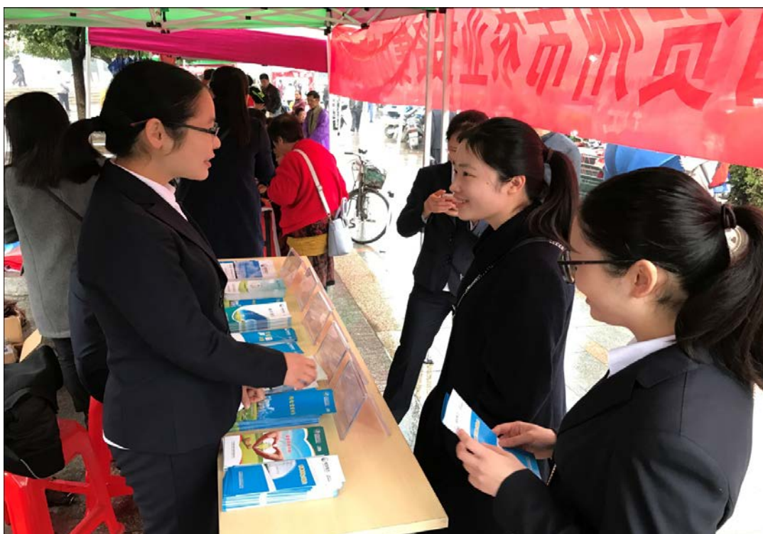
公司青年员工进行安全用电宣传和业务办理流程讲解

为了加强用户的安全用电意识，保障市民日常用电安全，公司积极开展供电、用电服务宣传，不定期举行“安全生产宣传咨询日”等活动。公司营销部与客户服务中心等部门多次组织相应岗位人员及公司青年志愿者，通过制度上墙、客户调研、设立咨询服务台、宣传展板等多种形式向当地市民宣传用电常识、缴费途径以及电力政策、电力法律法规，解答客户用电咨询，受理客户投诉，增加客户对公司的了解度和认可度。同时，公司继续施行“银电合作”政策，向客户提供方便快捷的缴费方式，由银行代扣代交电费，真正做到利民、便民、省时、省力。