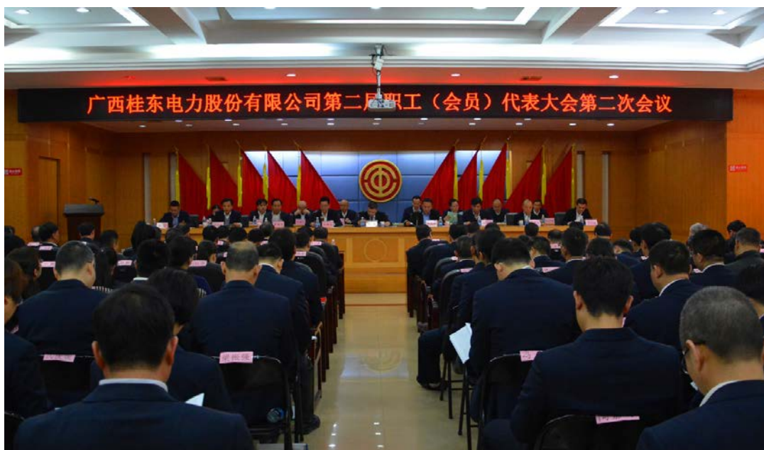
桂东电力第二届职工（会员）代表大会第二次会议圆满召开

除依据《公司法》和《公司章程》的规定选举职工监事、职工董事，确保职工在公司治理中享有的合法权利外，公司还成立了职代会提案审理督办工作委员会，通过组织召开“提案审查督办工作会议”或职工代表座谈大会的形式，对职代会的提案及建议进行汇总、审查，对工资、福利、劳动安全卫生、社会保险等涉及职工切身利益的事项，听取职工意见和建议，认真做好提案反馈督办工作。司务公开工作稳步推进，把企业改革发展难点、职工关注的热点、企业廉政建设的关键点作为司务公开的重点，不断提高司务公开工作制度化、规范化水平，让职工享有充分的知情权、监督权。